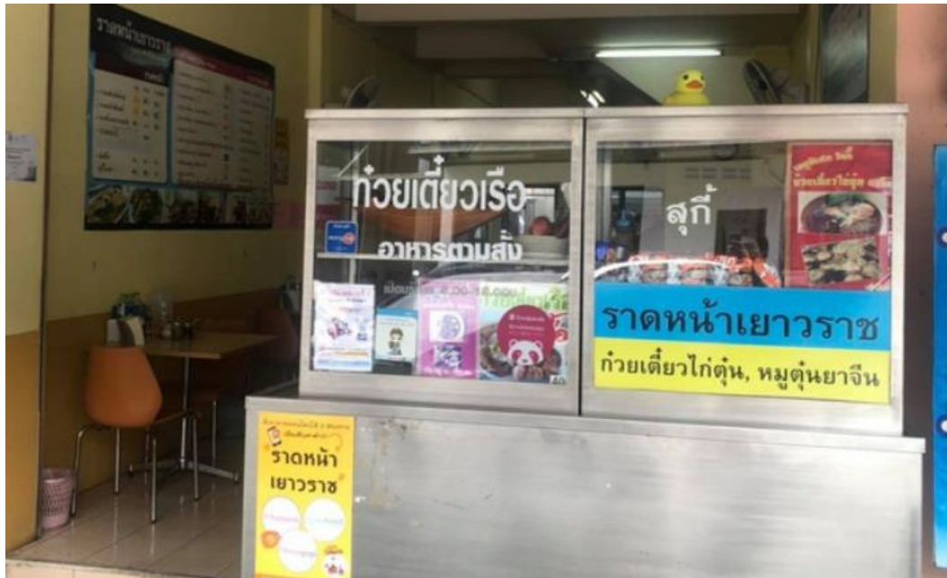
ภาพที่ ค.3 ด้านหน้าร้านของร้านราดหน้าเยาวราช