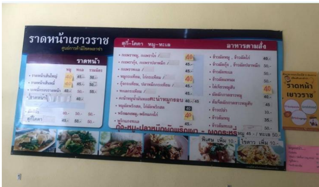
ภาพที่ ค.4 เมนูของร้านราดหน้าเยาวราช